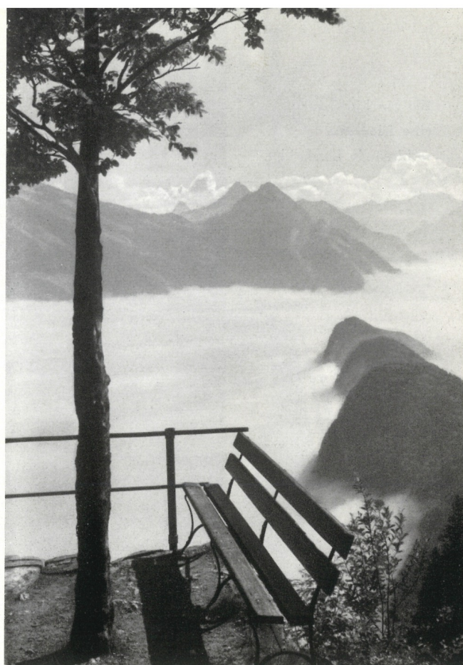
Honegg - Känzeli