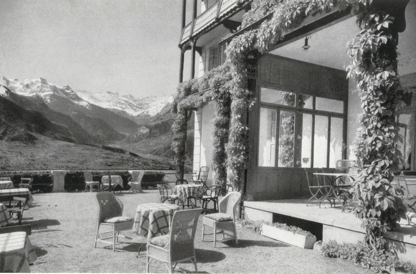
Die prächtige Umgebung und das schöne Hotel ergänzen sich harmonisch