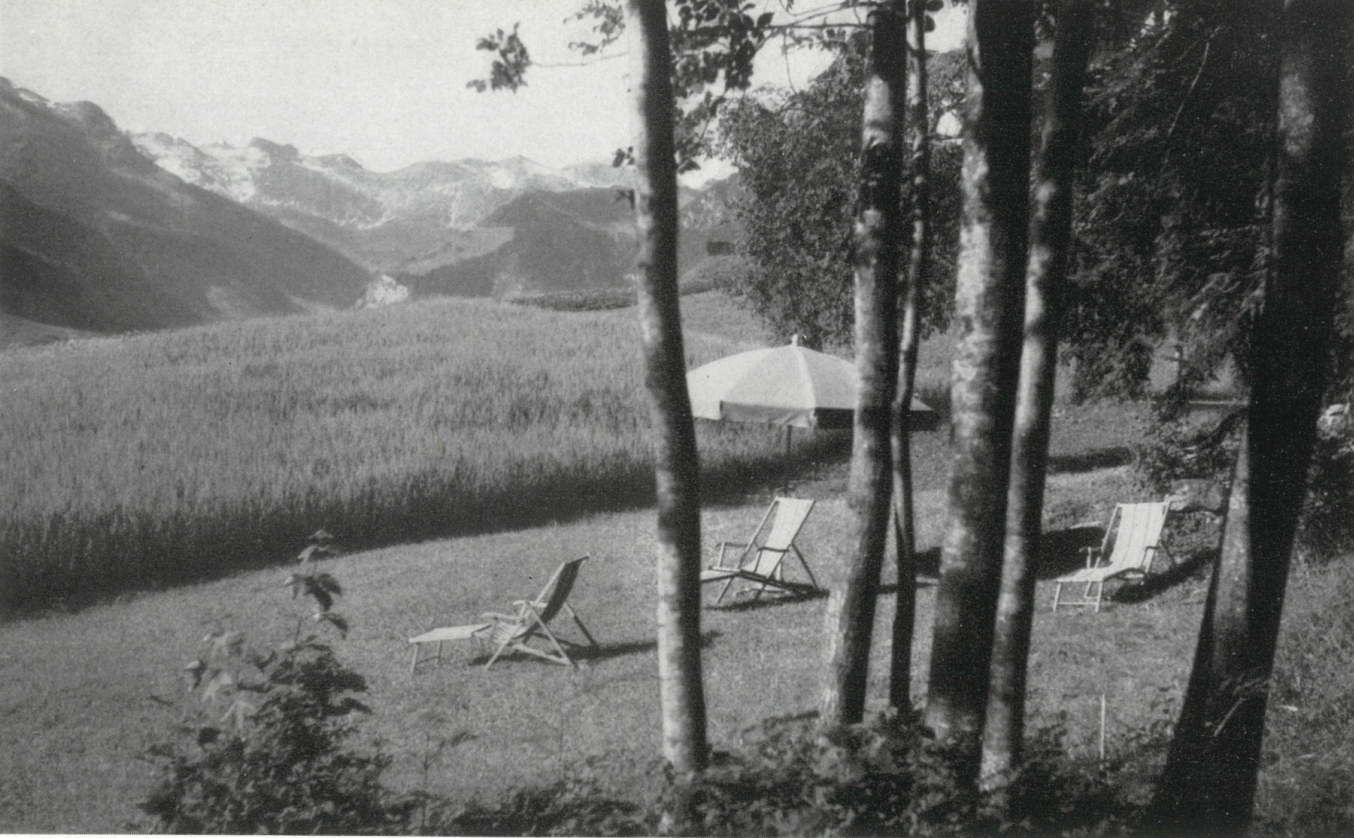
Auf der Liegewiese, wenige Schritte neben dem Hotel, holt man sich die gesunde, braune Ferienfarbe