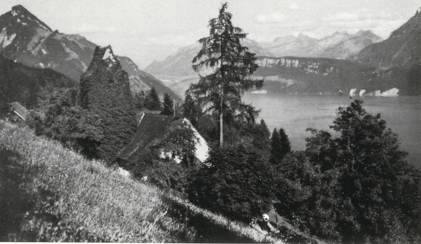
St. Jost-Kapelle, in Urkunden schon im Jahre 1346 erwähnt, eines der vielen reizenden Spazierziele