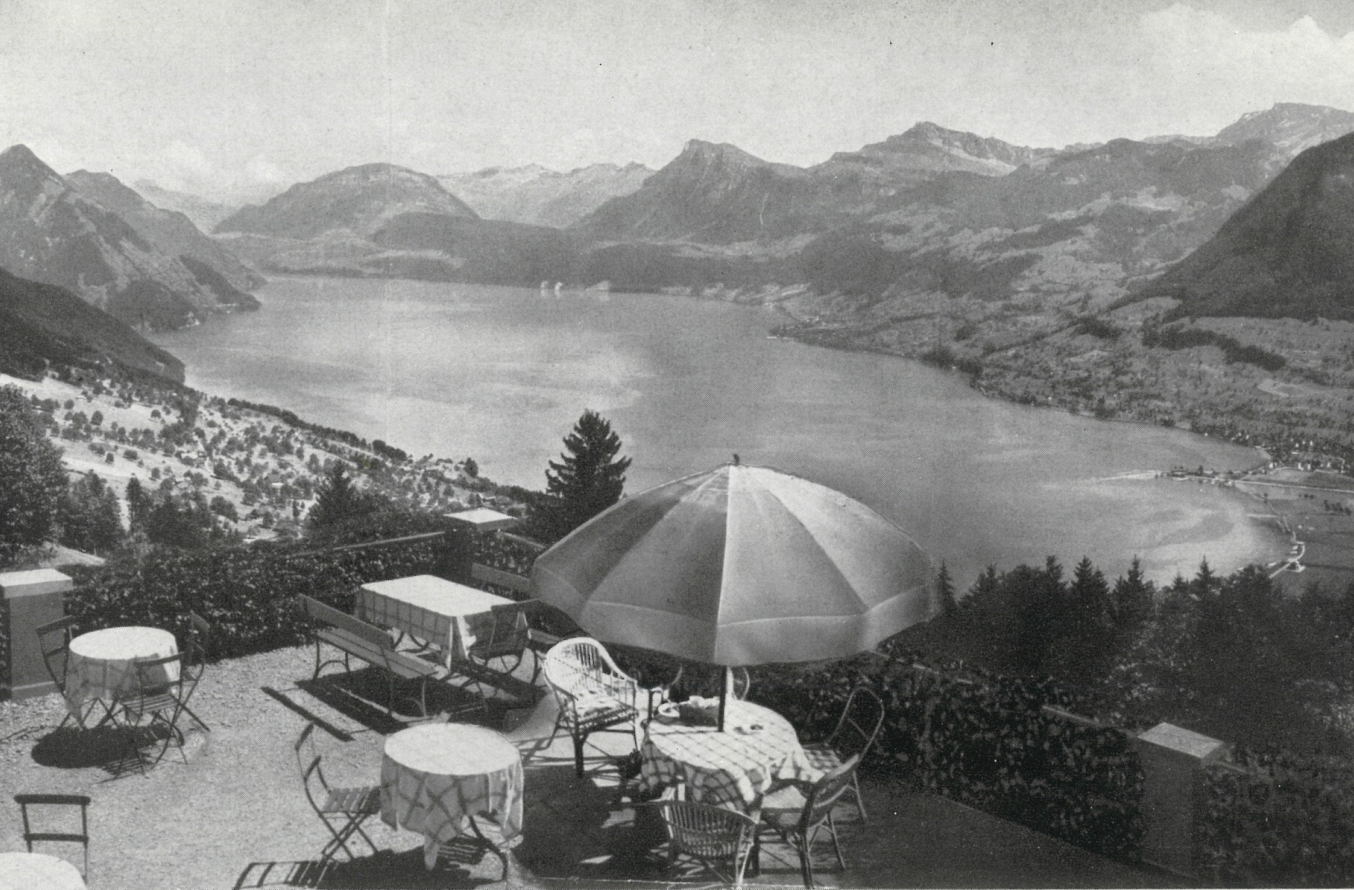
Sonne und Schattenbäume auf der Terrasse, ein „zu Hause“ im Freien