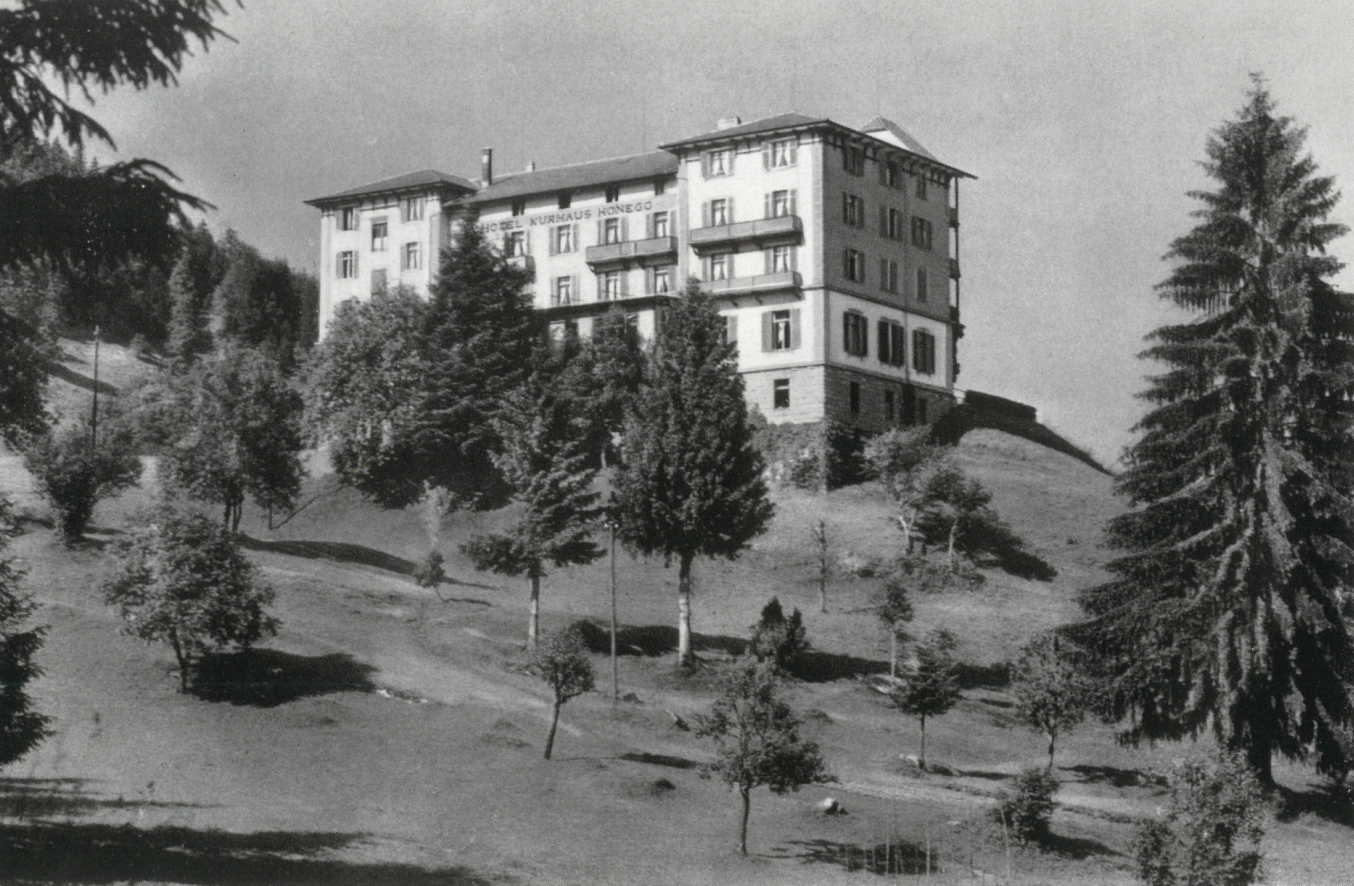
Wettertannen sind unsere Zierbäume — Bergblumen füllen die Wiesen